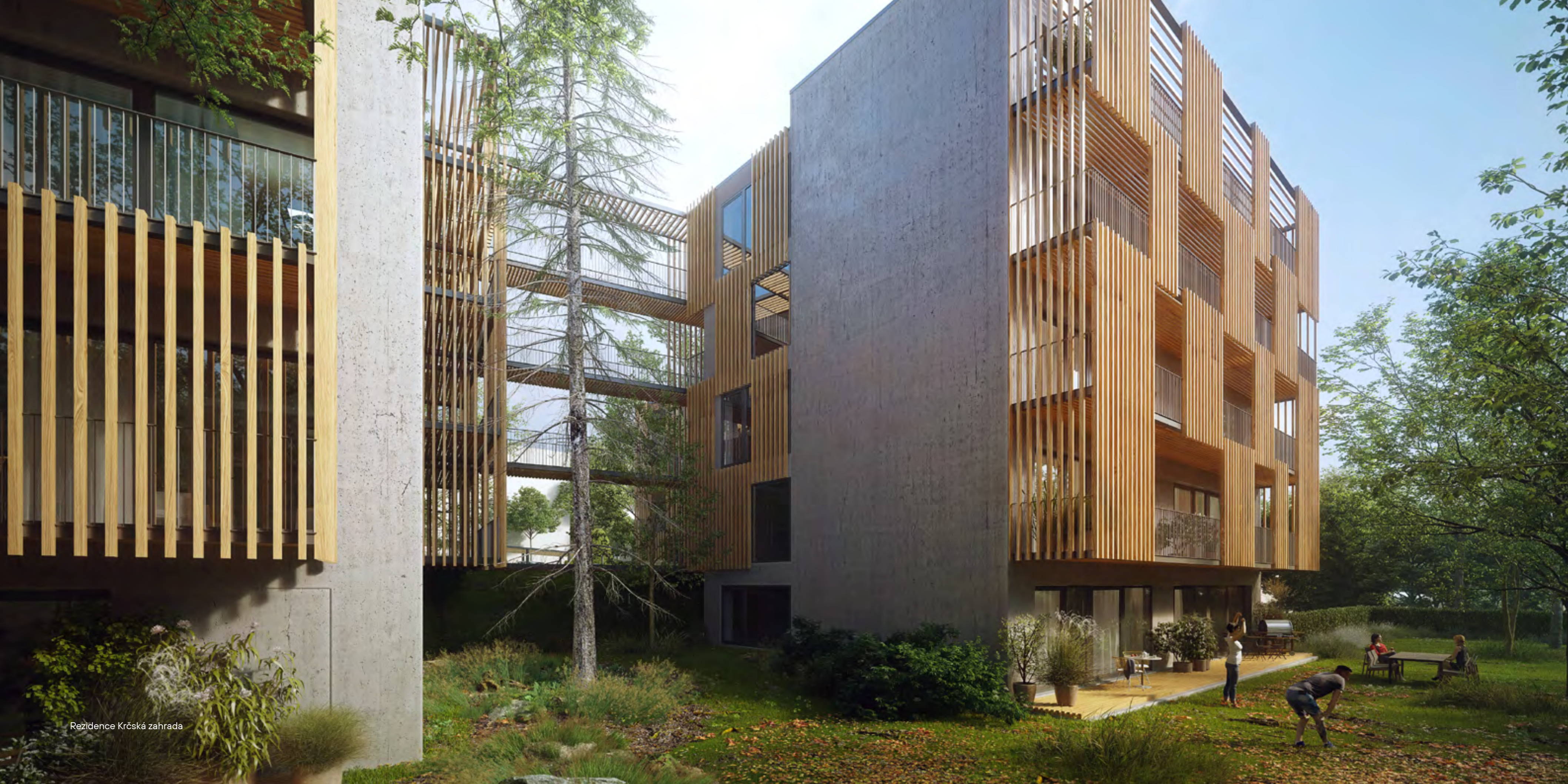
Rezidence Krčská zahrada