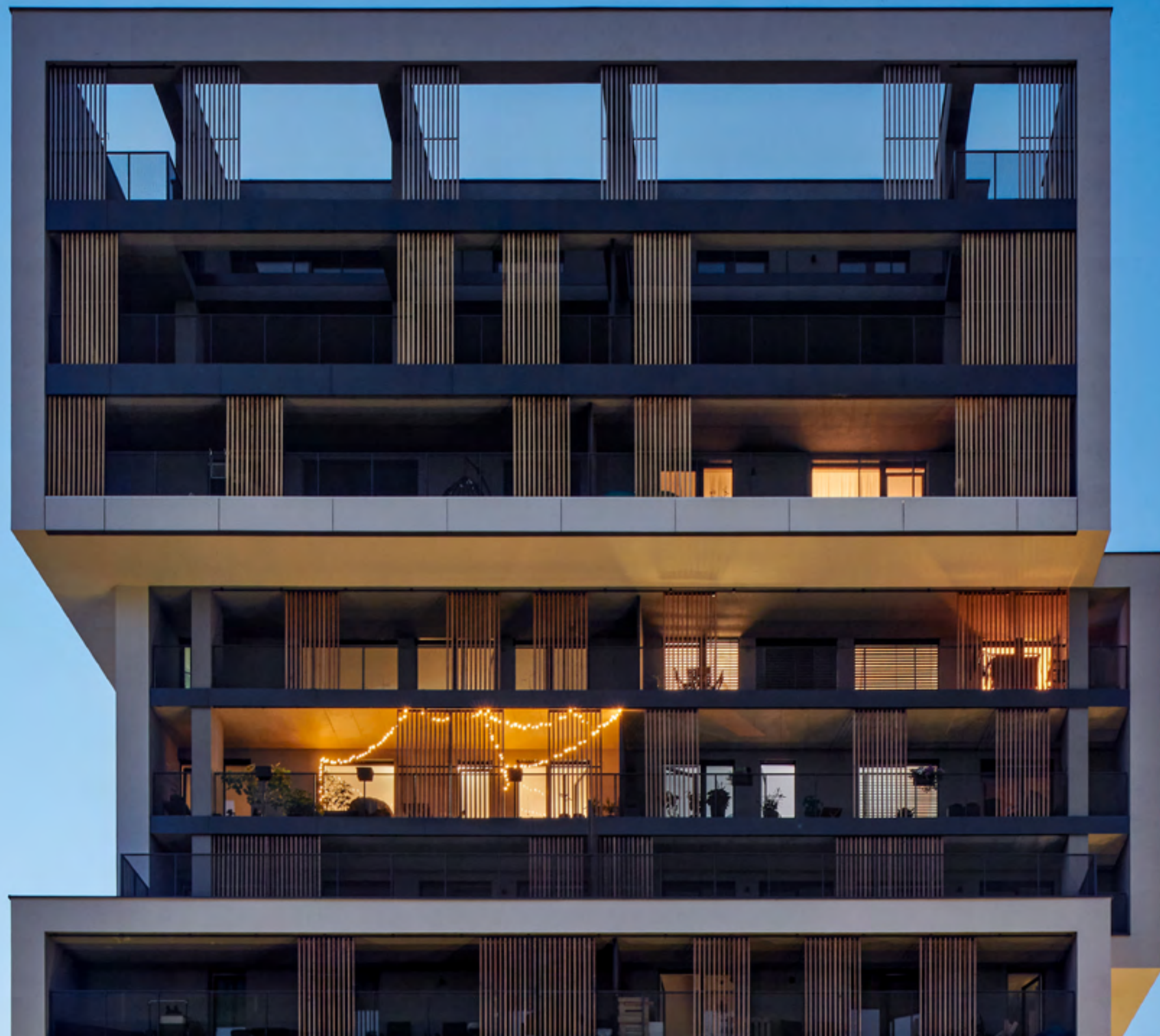
Bytové domy Výhledy Rokytka