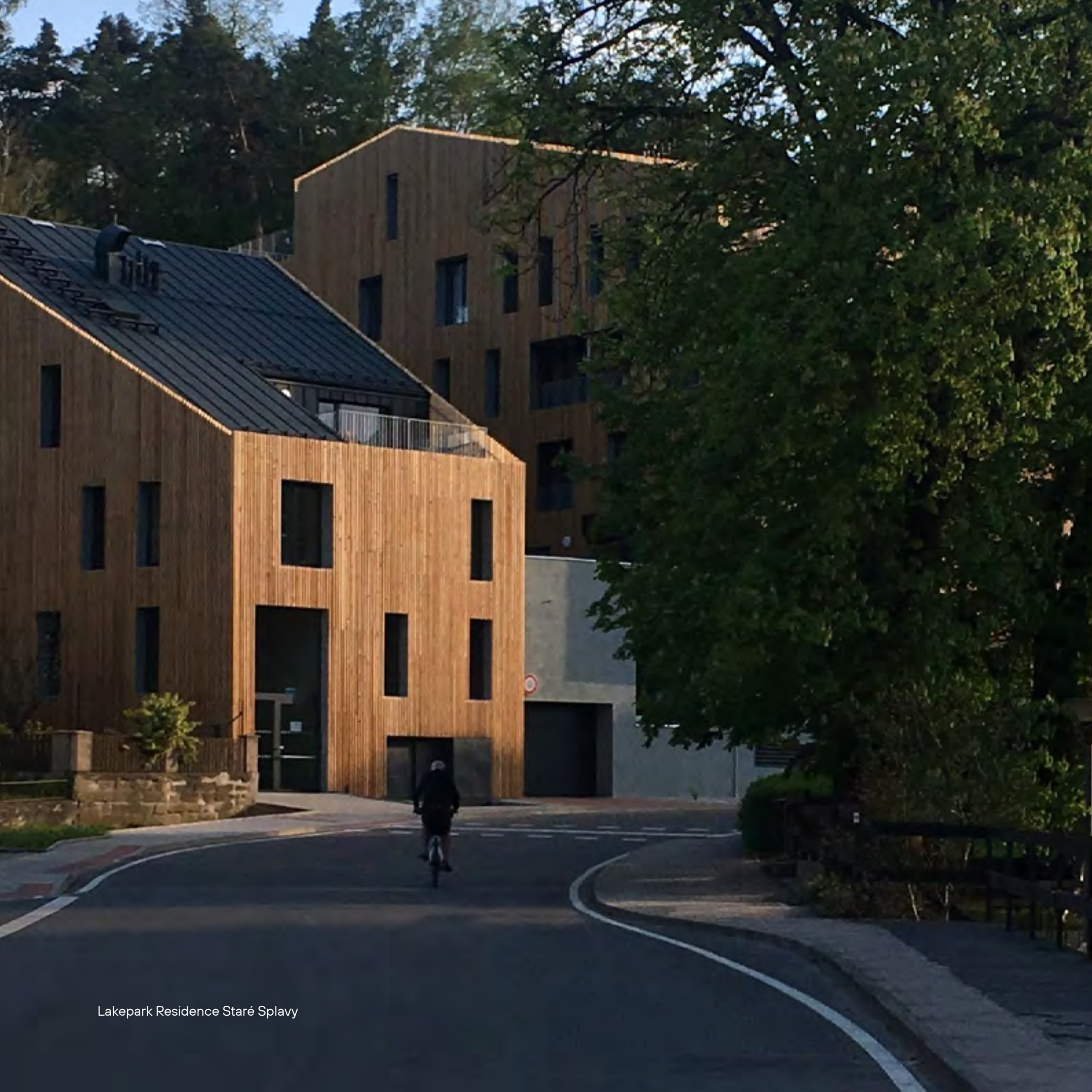
Lakepark Residence Staré Splavy