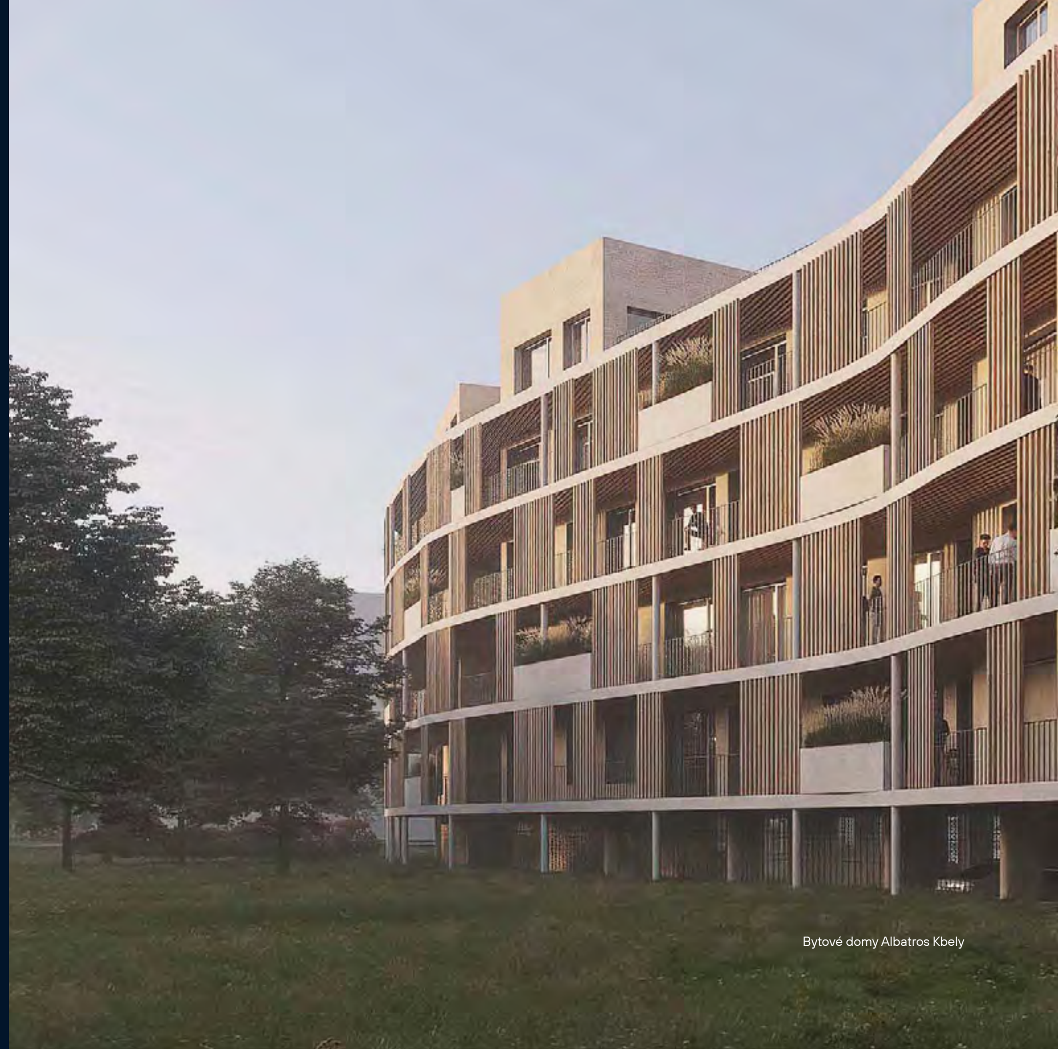
Bytové domy Albatros Kbely

Podporujeme smysluplné společensky odpovědné projekty, jak v oblasti kultury, tak i sportu a hledáme cestu k podpoře organizací pomáhajících potřebným.